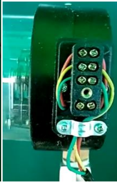
水位计探针和接电压力表